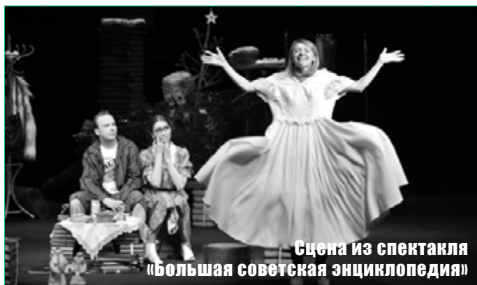
Сцена из спектакля «Большая советская энциклопедия»