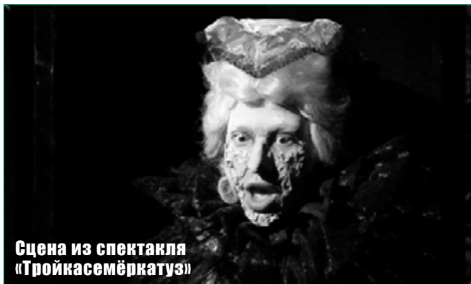
Сцена из спектакля «Тройкасемеркатуз»

Это жутковатая и в чём-то сюрреалистическая комедия, в основе которой – разноязычие. Главного героя Германна окружающие не понимают в буквальном смысле: он немец и весь спектакль он говорит по-немецки. Спектакль из Кишинёва – яркая театральная фантазмагория, перекликающаяся с сегодняшним временем.