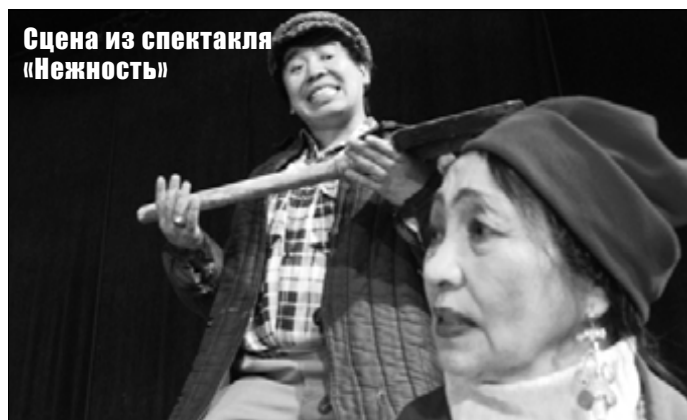
Сцена из спектакля «Нежность»

Для спектакля из Франции под названием «Принимая во внимание», пожалуй, перевод не потребуется: театральная компания «Ля Шартрез» предлагает яркое мультимедийное действие, составленное из музыки, песен и театральных световых спецэффектов.