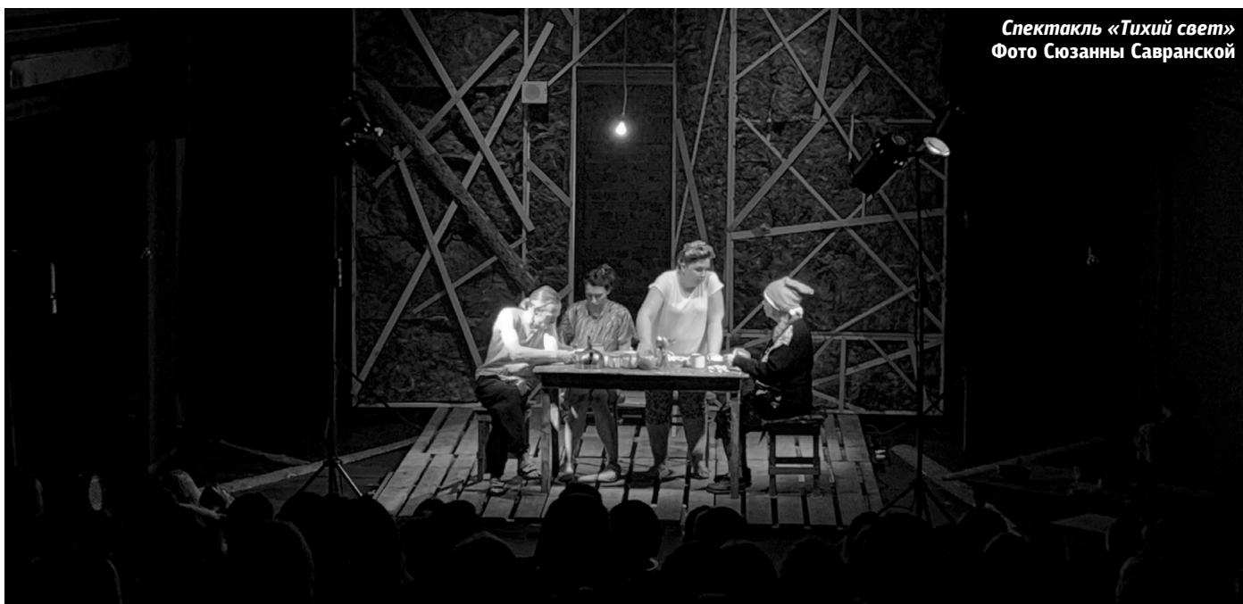
Спектакль «Тихий свет»

В этом безумии всех объединяет лишь одна мысль – если бы была возможность все исправить, если бы был еще один шанс, каждый бы что-то изменил в своей жизни. Люда бы не тратила жизнь на Валу, Тома бы стала богатой и знаменитой, Микола бы... Возможно, Микола все еще был бы жив. Забавно и больно