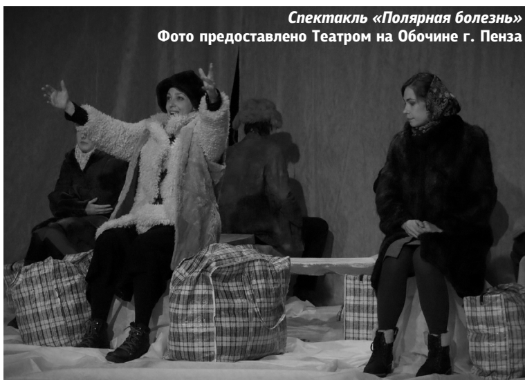
Спектакль «Полярная болезнь»

Сочетание глубины смысла и легкости подачи поражает. Благодаря неприязтельности и честности героев проникаешься их историями, проживаешь путешествие вместе с ними. Почти чувствуешь тряску в старом автобусе и постоянный холод.