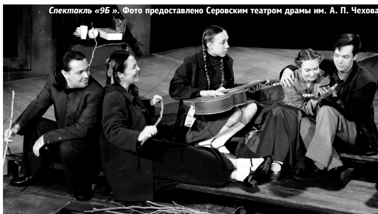
Спектакль «95».