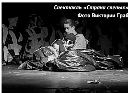
Спектакль «Страна слепых»

Виктория Граб, студентка Департамента журналистики УрФУ