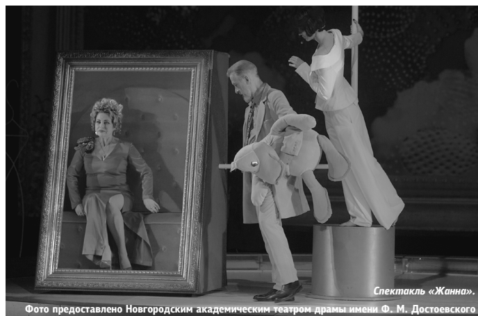
Спектакль «Жанна».

Можно сказать, что при всей своей контрастности могильный камень и богатая постель – две стороны одной большой беды отцов и их детей. Ведь, по сути,