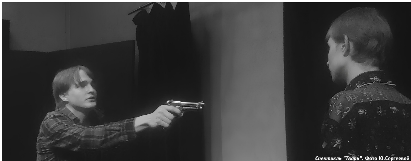
Спектакль «Тварь».

Юлия Сергеева, студентка Департамента журналистики УрФУ