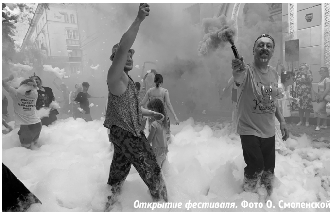
Открытие фестиваля.

Ольга Смоленская, студентка Департамента журналистики УрФУ