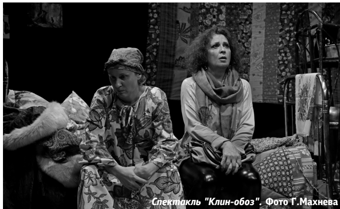
Спектакль "Клин-обоз".

Н енависть, алчность, зависть... У нас внутри сидит демон. У каждого – свой. И мы настолько к ним привыкли, что даже не замечаем этих чудуц: мокрых, гнилых, злых. О том, как любить и ненавидеть, поведали зрителям артисты «Театра без театра» (г. Омск) в спектакле «КЛИН-ОБОЗ» по пьесе Николая Коляды.