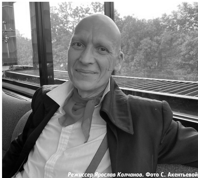
Режиссер Ярослав Колчанов.

Светлана Акентьева, студентка Департамента журналистики УрФУ