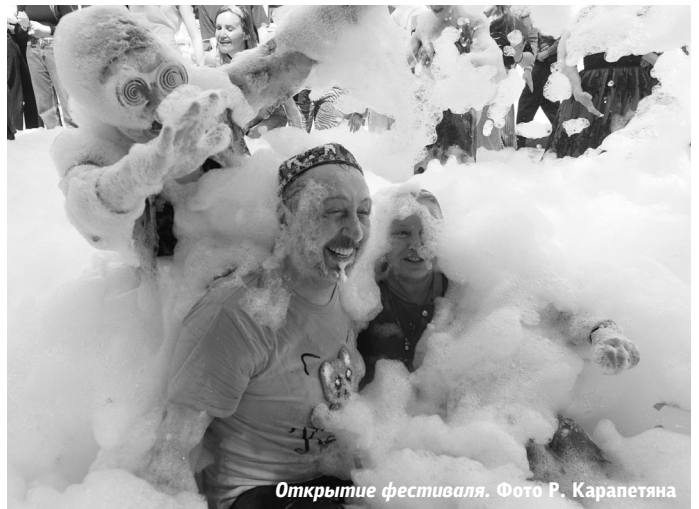
Открытие фестиваля.

Танцы в море пены, хлопушки с конфетти, разноцветный дым и мыльные пузыри стали уже неотъемлемой частью первого дня фестиваля. В этот жаркий, летний день в центре Екатеринбурга каждый, независимо от возраста, мог какое-то время чувствовать себя ребенком – танцевать до упаду, нырять в пену с головой, от души веселиться и смеяться.