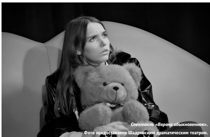
Спектакль «Ворона обыкновенная».