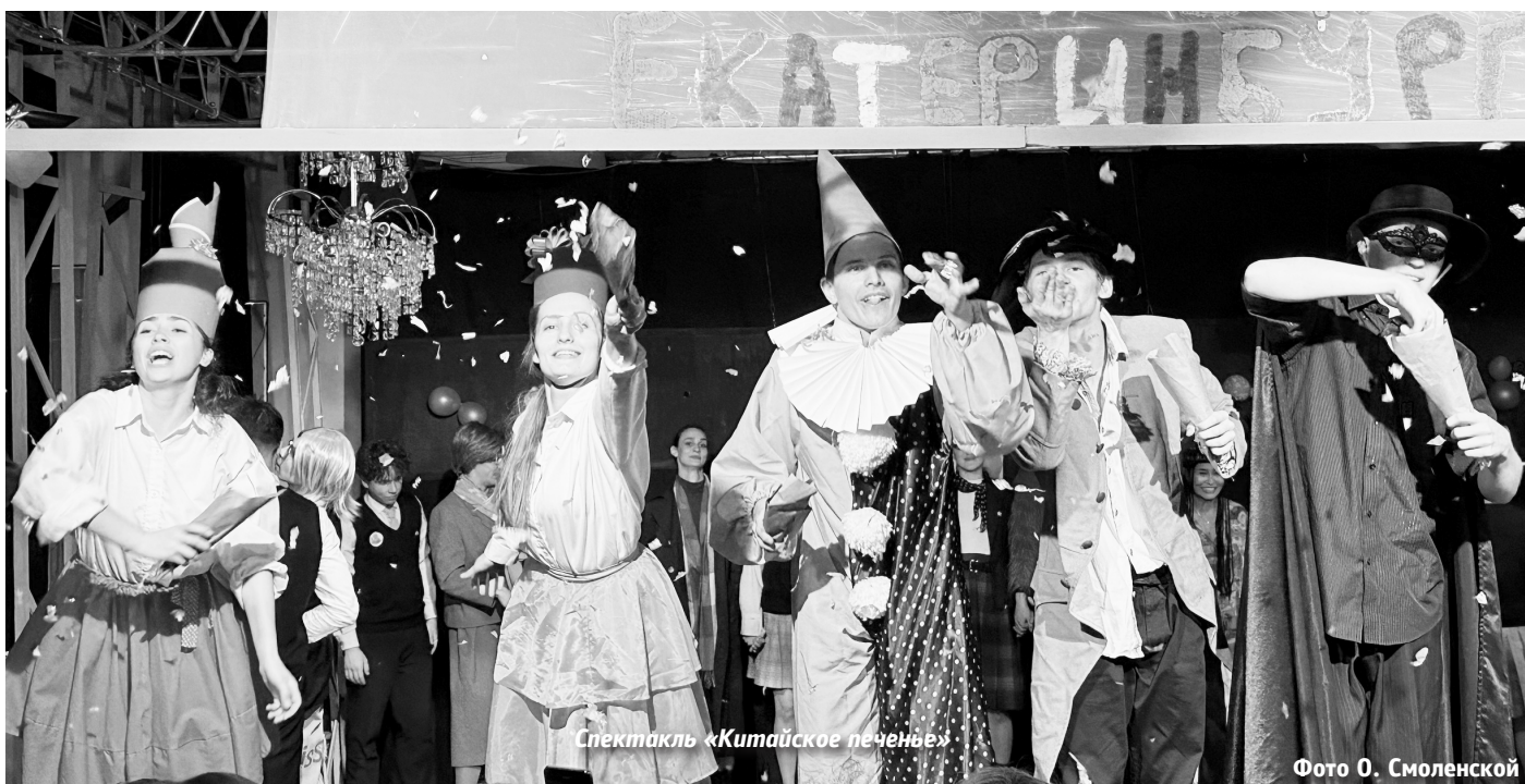
Спектакль «Китайское печенье»